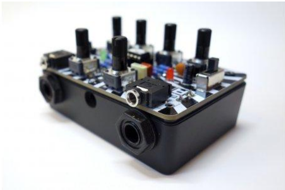
ATtiny Punk Console by Noisio

Gäste: Alwin Weber (Circuit Circle, Dresden), Steffen Koritsch (Noisio, Dresden)